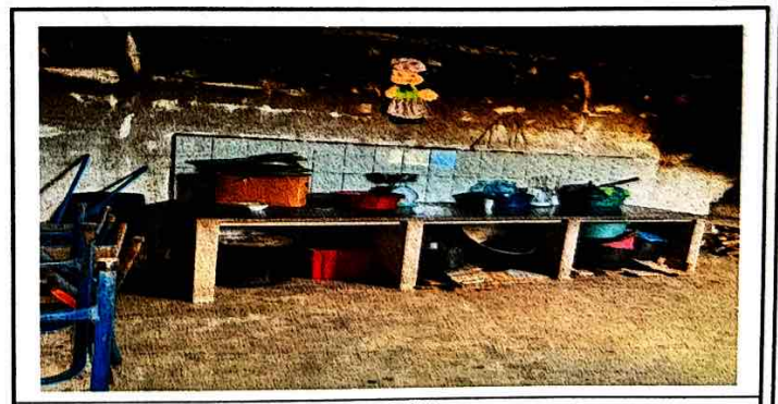
SUSTITUCION DE PINTURA DE LA COCINA

Observación: Si es necesario se pueden agregar hojas adicionales. Número de hojas.