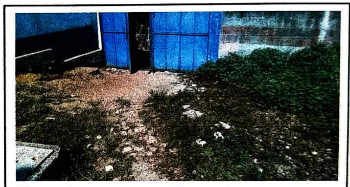
SUSTITUCION DE PISO DE ENTRADA DE LA ESCUELA