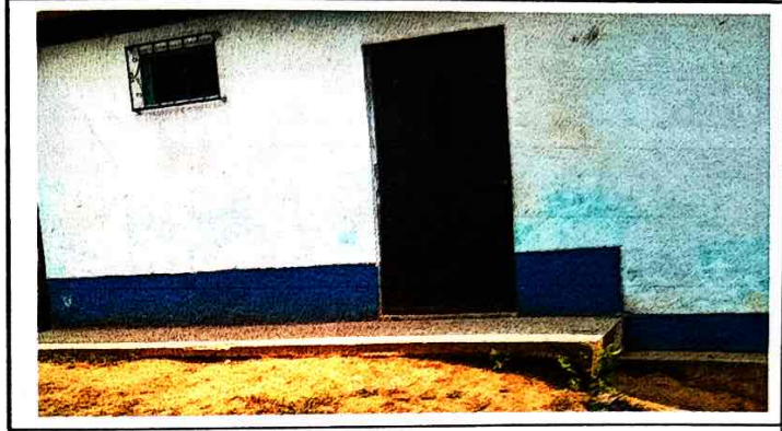
SUSTITUCION DE PUERTA