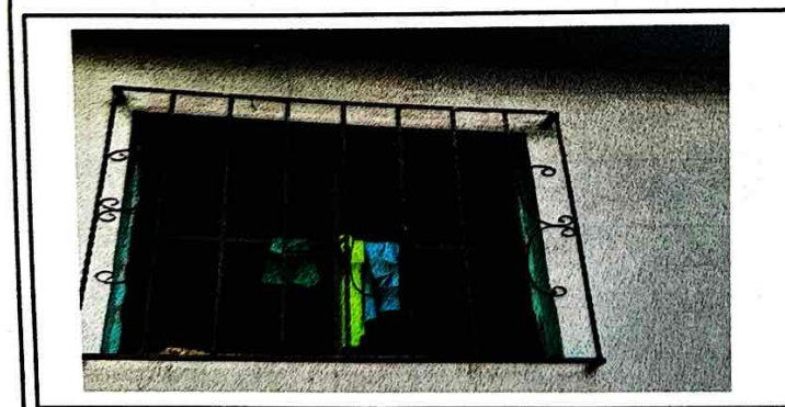
SUSTITUCION DE VENTANAS