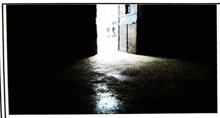
SUSTITUCION DE PISO DE CEMENTO DE LA COCINA